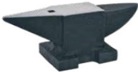
ΑΤΣΑΛΙΝΟ ΑΜΟΝΙ ΑΘΡΑΥΣΤΟ 30 KG