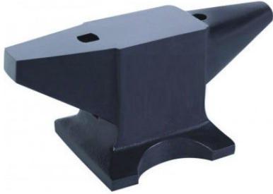
ΜΑΝΤΕΜΕΝΙΟ ΑΜΟΝΙ 10 KG

www.promac.com.gr e-mail: info@promac.com.gr